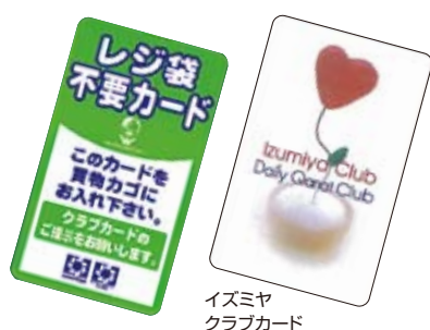
イズミヤ クラブカード

マイバッグ持参運動は、お客様に環境問題を身近に意識していただける取り組みの一つです。1998年6月からスタートし、13年目を迎えた2010年度の2月末の持参率は42.6%という結果でした。2010年9月和歌山店、紀伊川辺店が県の有料化中止を受け、マイバッグ持参運動の対象から外れたのも一因です。