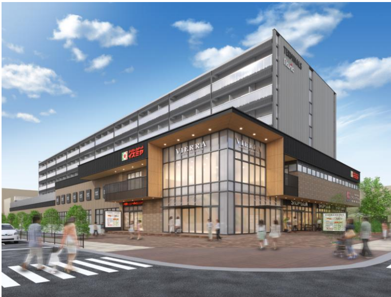
商業施設「ビエラ茨木新中条」外観イメージ