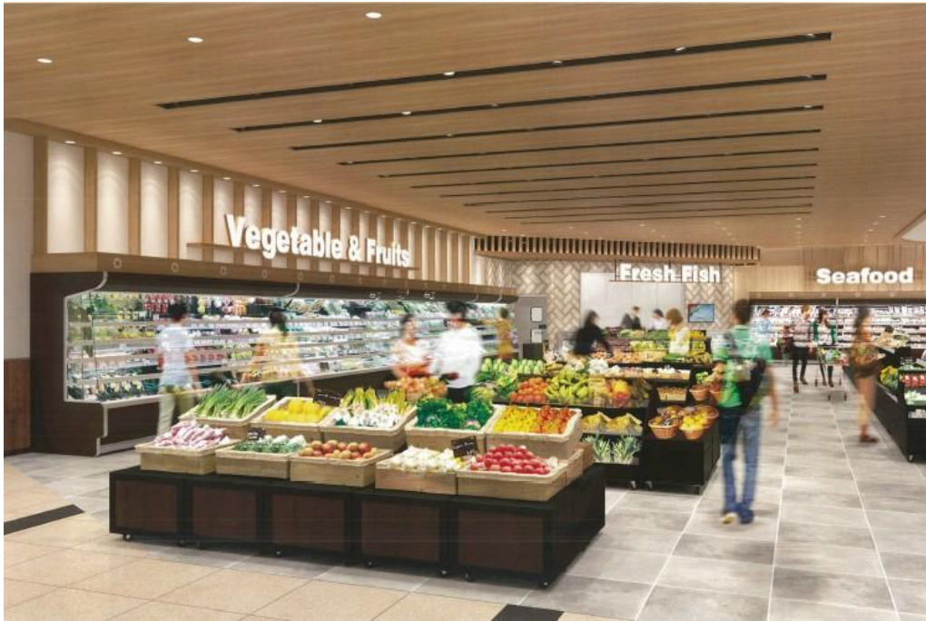
生鮮売場イメージ