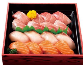
「とろ三味にぎり盛合せ」