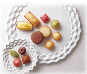
「アンリ・シャルパンティエ」

阪急百貨店のデパ地下で人気の「アンリ・シャルパンティエ」や「叶匠壽庵」の和洋菓子を取り扱いし、贈り物や手土産としてご利用いただける商品を新たに品揃えいたします。さらに毎週土曜日にはスイーツワゴンを設置し、阪急百貨店でおすすめの商品を週替わりで数量限定販売いたします。